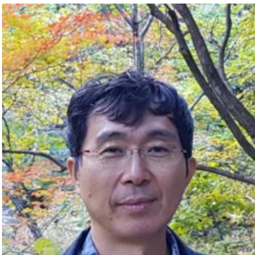
Kyu-Hyun Chae.

MoND se točí kolem podezřelé rotace spirálních galaxií, což je fenomén, který donutil fyziky zahrnout účast temné hmoty. Jde o to, že by rotační rychlosti částí galaxií vzdálenějších od galaktických center, kde je nashromážděna většina viditelné hmoty galaxií, měly teoreticky klesat, ale podle pozorování reálných galaxií neklesají. Chyba je na straně fyziků, když dosazují za R-vzdálenost mezi dvěma tělesy vzdálenost v přímé úsečce namísto v úsečce v oblouku ...! http://www.hypothesis-of-universe.com/docs/c/c_439.jpg ; http://www.hypothesis-of-universe.com/docs/c/c_440.jpg ; Obloukovou křivku „R“ je zapotřebí zjistit pozorováním tvaru dané galaxi. Když sledujeme hvězdy v galaxiích, které jsou různě vzdálené od jejich center, tak všechny obíhají kolem centra zhruba stejnou rychlostí.