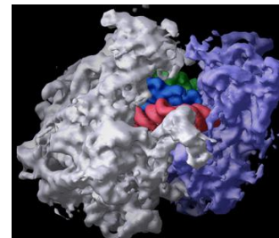
ribosome „jako“ lívance galaxií