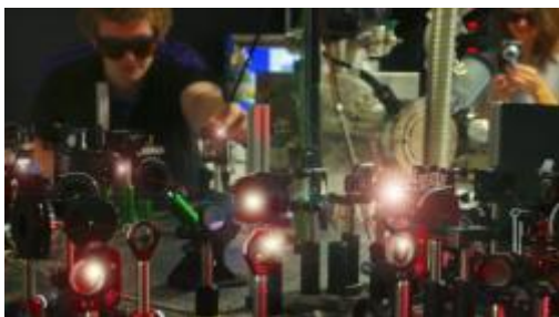
Kvantová fotonika v akci.

Podle Westerberga a spol. je jejich systém vlastně formou parametrického zesilování (parametric amplification), při němž laserové pulzy emitují záření různých vlnových délek. Parametrické zesilování přitom tradičně zahrnuje médium, jako je krystal, který je mnohokrát delší nežli vlnová délka přicházejícího záření. Za takových okolností samotné médium neosciluje a oscilace vznikají jenom uvnitř tohoto média. V zařízení navrženém Westerbergem a spol. je médium tenčí než vlnová délka přicházejícího záření, proto by toto médium mělo oscilovat. V obou případech jde přitom o dynamický Casimirův jev, při němž vznikají fotony kvůli náhlým změnám v dotyčném médiu.